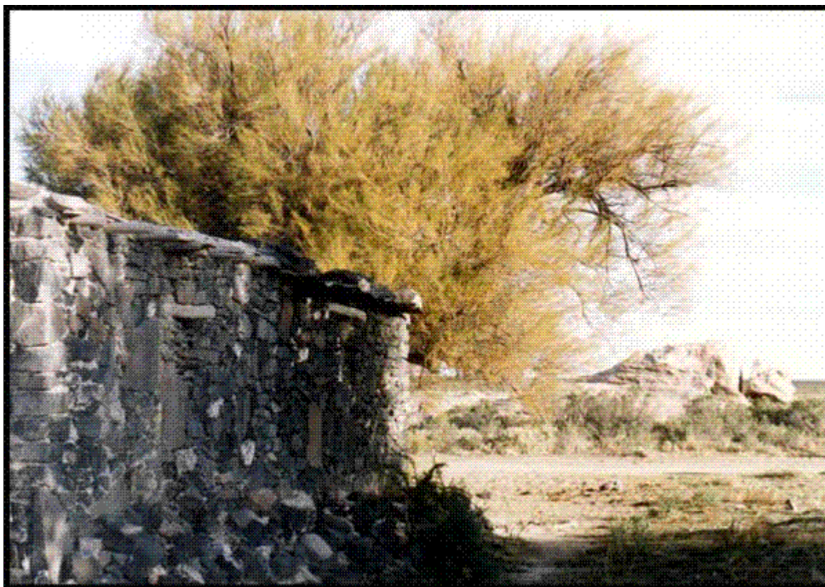
Fotografía 1. Casa construida con piedra de Chos Malal