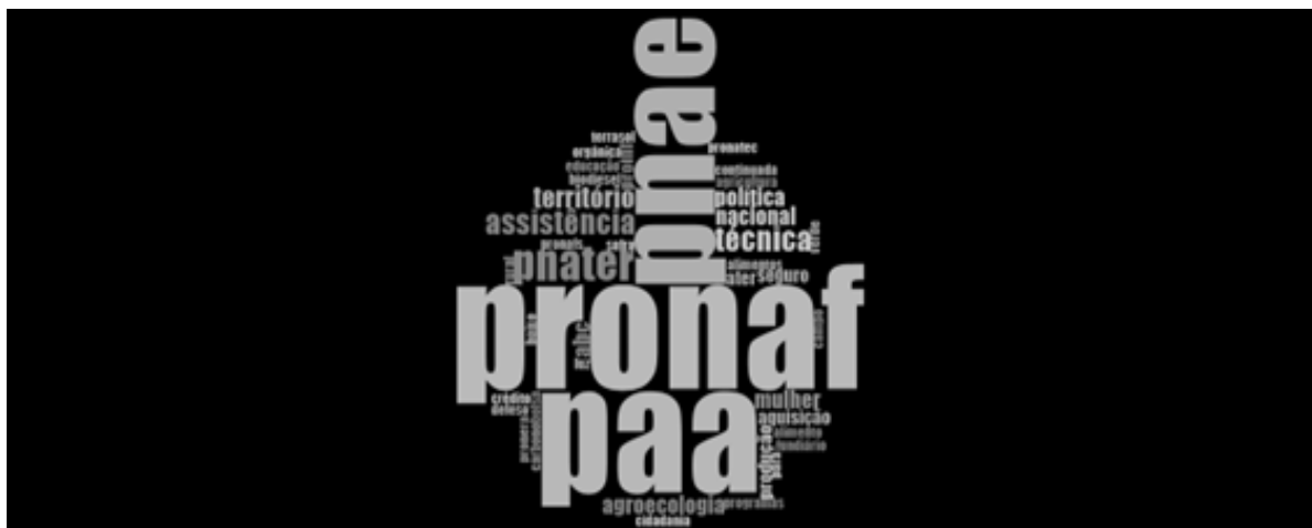
FIGURA 1 Nuvem de palavras extraída da categoria “políticas públicas mais importantes de inclusão produtiva”