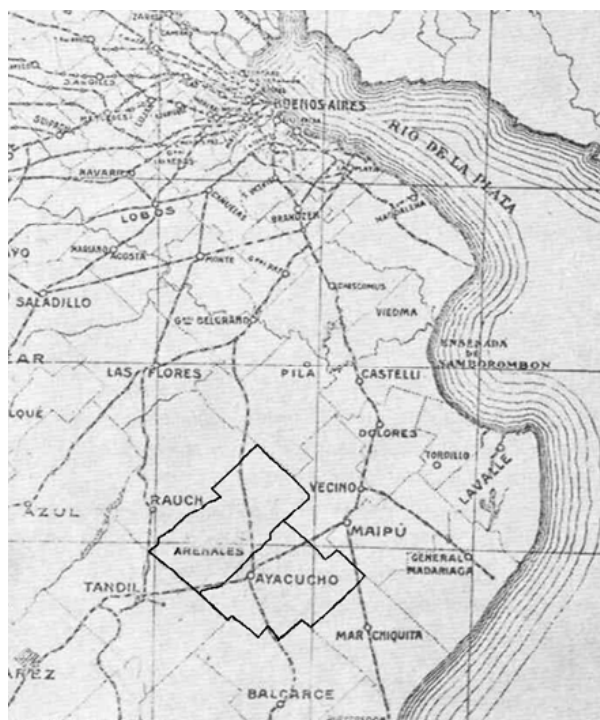
Mapa 1: Partidos de Arenales y Ayacucho, 1866