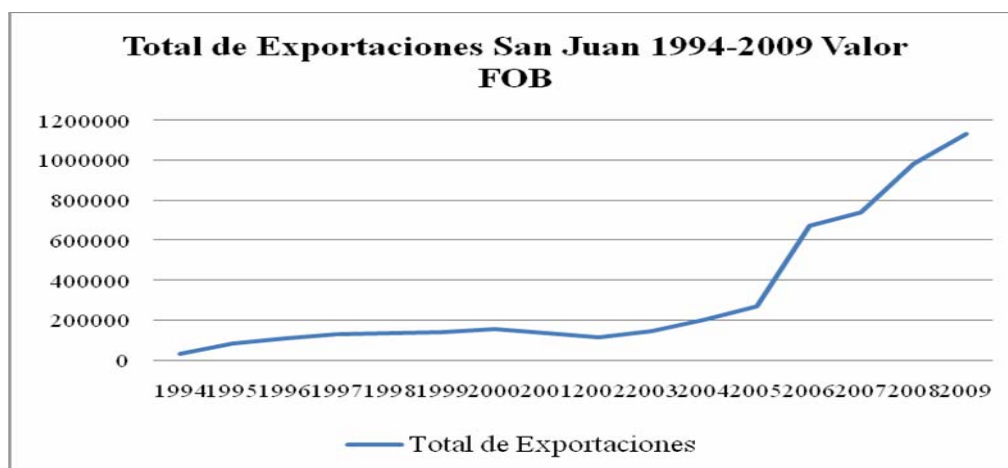
Gráfico II: Total de Exportaciones. San Juan 1994-2009. Valor FOB en miles de dólares

Fuente: IIEE sobre la base de datos procesados por INDEC.