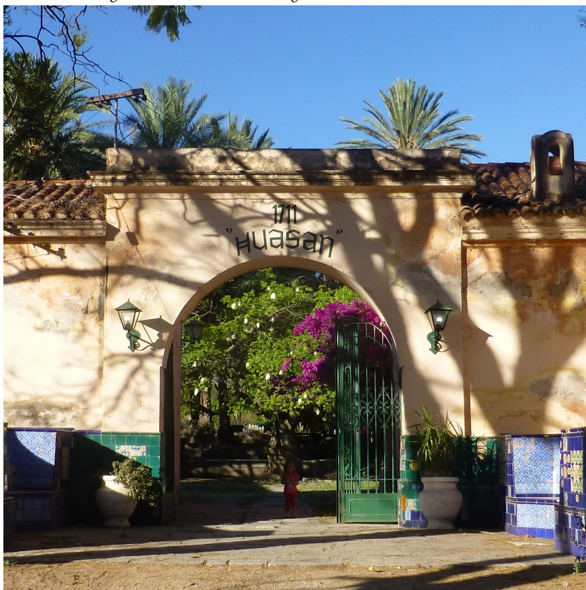
Imagen 1: Fachada actual de la antigua estancia de Santa Rita de Huasán