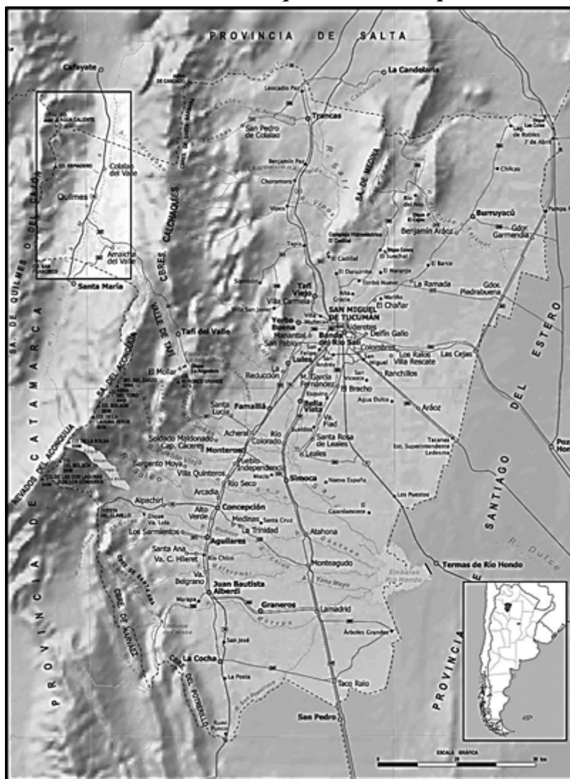
FIGURA 1 Ubicación del área de los valles calchaquíes tucumanos, provincia de Tucumán