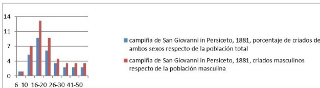
Figura 2 – Porcentaje de criados respecto de la población del grupo de edad, campiña de San Giovanni in Persiceto, 1881